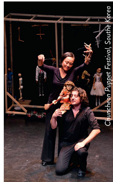
Cluncheon Puppet Festival, South Korea

Een woordeloze cabaretvoorstelling waarin elk personage zijn eigen verhaal vertelt door middel van beweging, muziek, live zang en interactie met de acteurs-poppenspelers. Het gezelschap maakt zijn eigen marionetten. Een voorstelling vol poëzie en plezier. De poppen leven, brengen emoties over en verrassen!